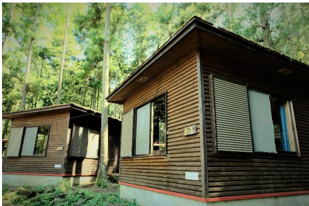
森の緑に囲まれたバンガロー