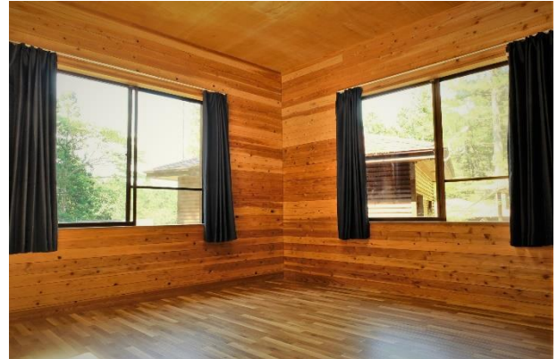
室内はコンセント1カ所、扇風機、掃除機が用意されています。